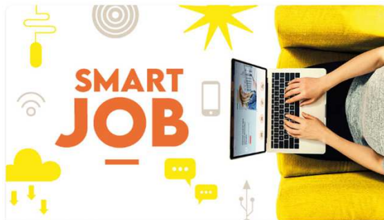
SmartJob - Atelier de sensibilisation numérique

Proposition de parcours de formation plus avancés, p.e. dans des centres de compétences